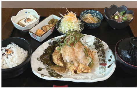
若鶏のからあげ梅おろし御膳