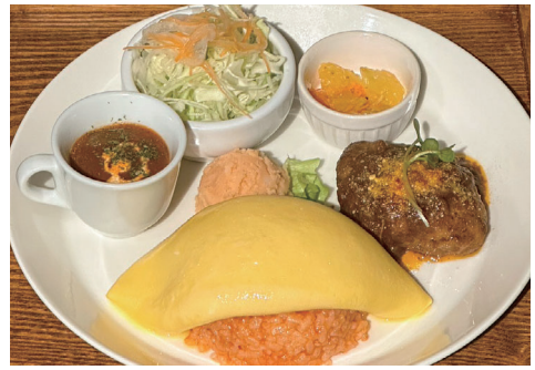
こcona洋風オムライス(ハンバーグ)