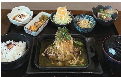
和風ステーキ風ハンバーグ