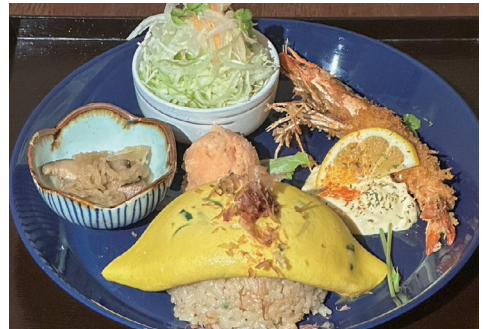
こcona和風オムライス(エビフライ)