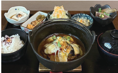
ビーフ煮込み風チーズハンバーグ