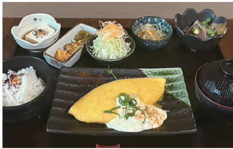
たらこチーズオムレツ御膳